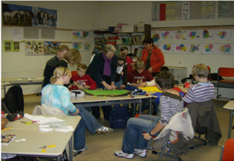
(Die Paten mit ihren Patenkindern)

Sie begleiten euch auf eurem Weg zur Bushaltestelle, zeigen euch, wie der Vertretungsplan gelesen wird und stehen euch auch zur Seite, wenn ihr einmal Probleme mit euren Mitschülern habt oder einfach nur nicht wisst, wo ihr einen bestimmten Fachraum finden könnt. Es gibt sogar besondere Spiel- und Bastelnachmittage mit euren Paten.