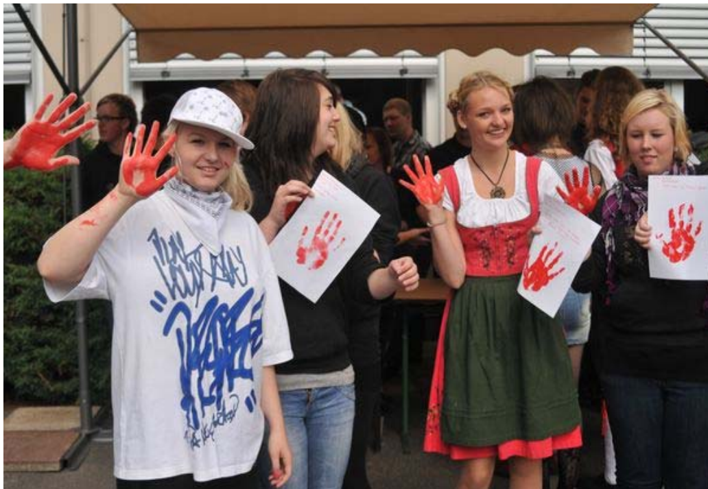
( Aktion „Rote Hand“-Projekt gegen den Einsatz von Kindersoldaten)