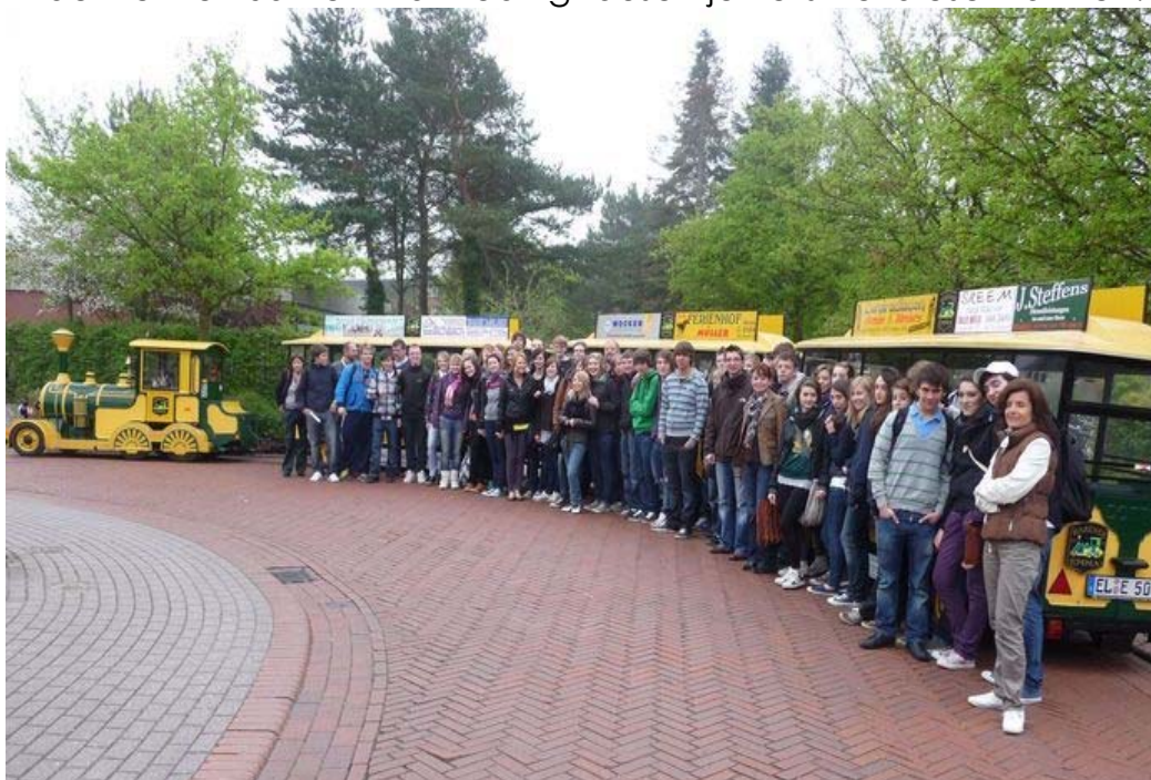
(Stadtrundfahrt mit der „Emma“)

In den letzten Jahren war Rödinghausen jeweils Ziel dieser Fahrten.