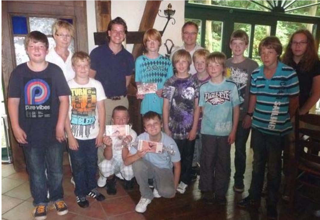
(Golfturnier auf Gut Düneburg)